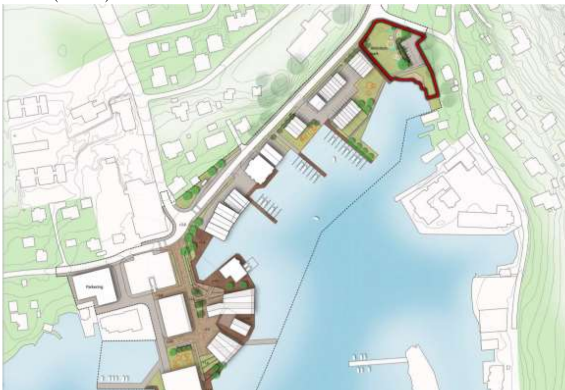
Fra reguleringsplan. Aktuelt område markert med rødt

Samme kunstner/kunstnergruppe vil ha hovedansvar for både Trinn 1 og 2, og det forventes forslag til begge trinn i den lukkede konkurransen (selv om forslagene til Trinn 2 kan være noe løsere). Det åpnes likevel for at «hovedkunstneren» kan trekke inn andre, samarbeidende kunstnere til f.eks Trinn 2 (se s. 13).