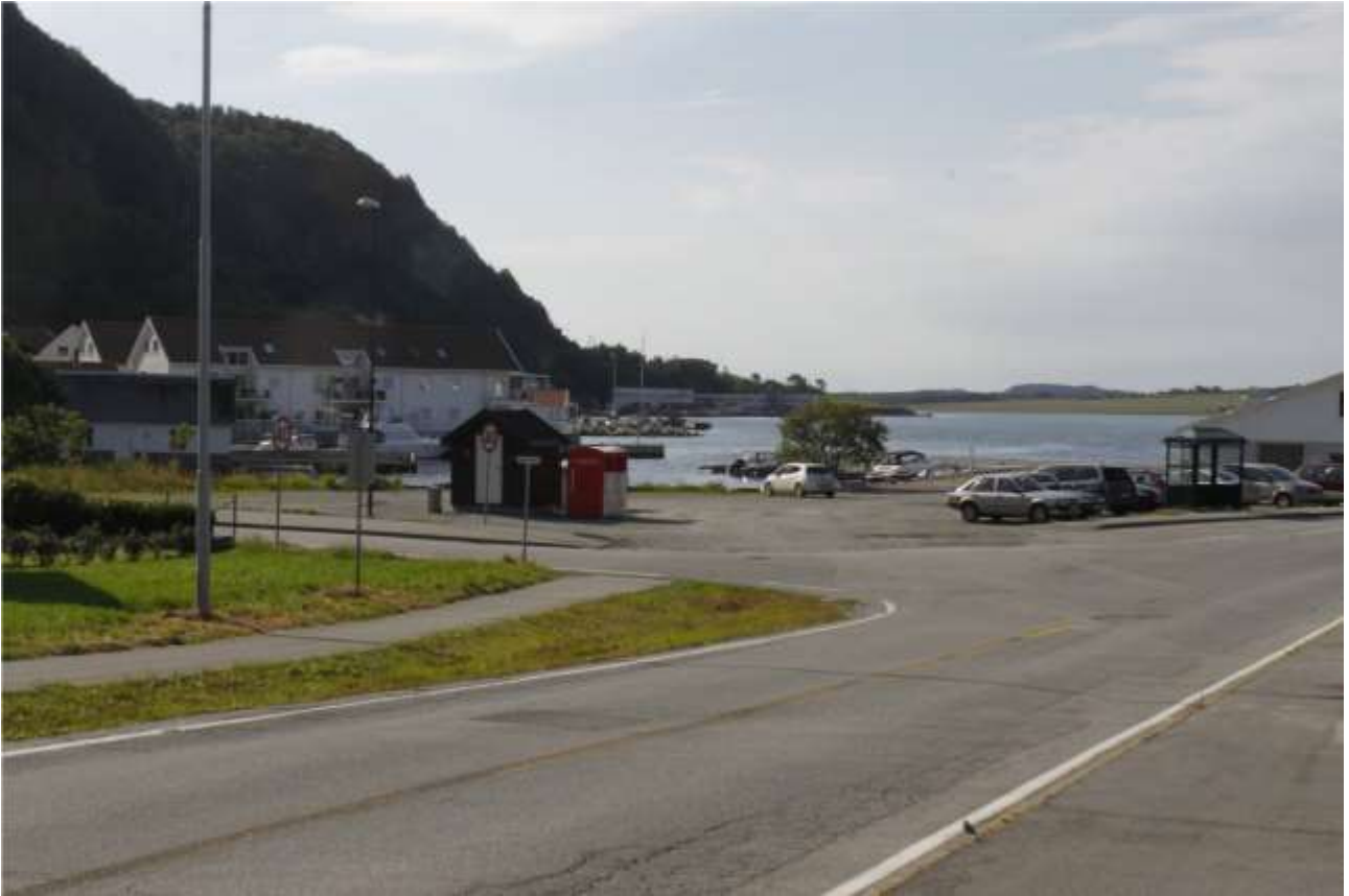
Utsikt fra innfartsveg