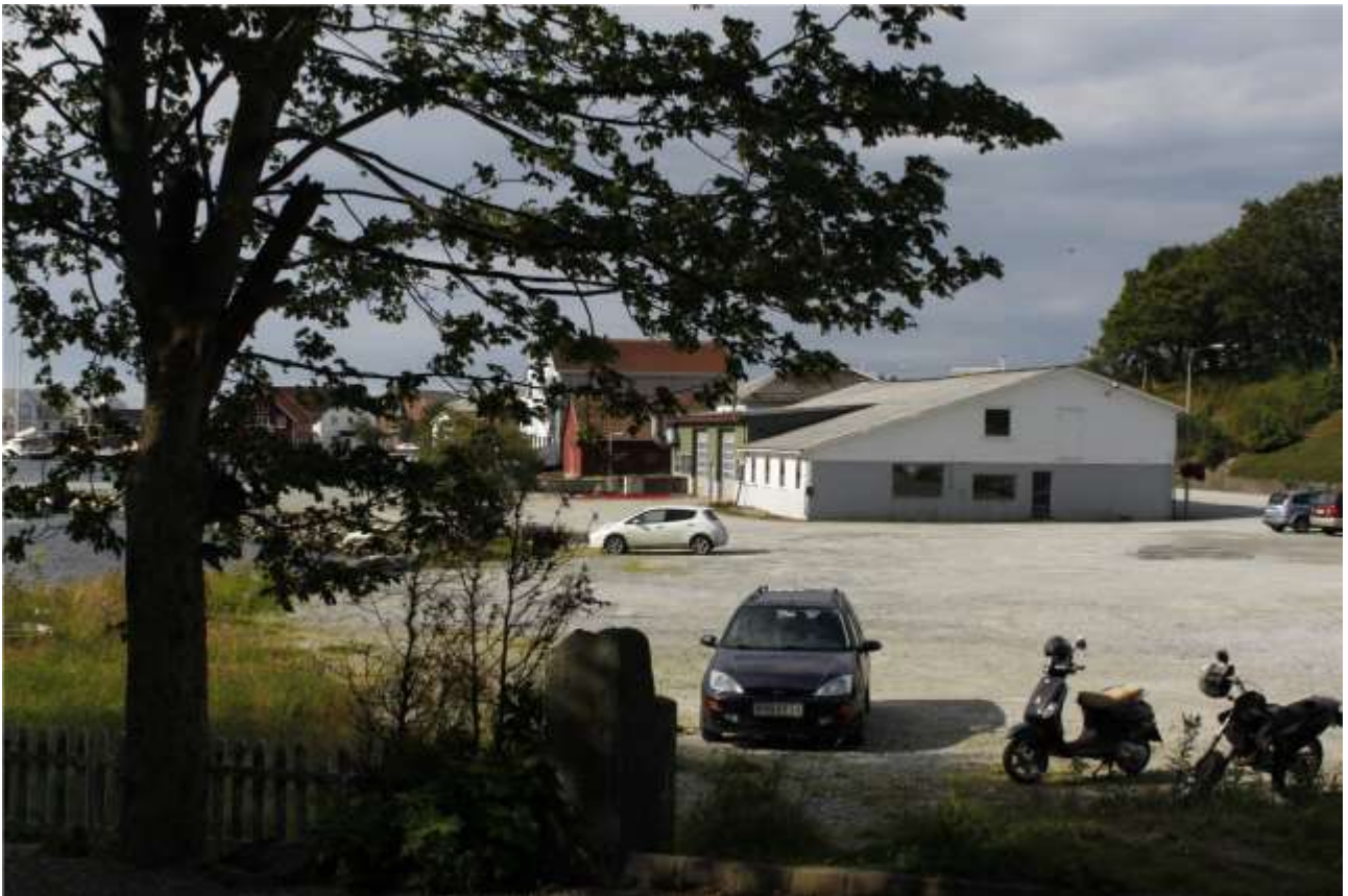
Tomta sett fra boligområde i øst