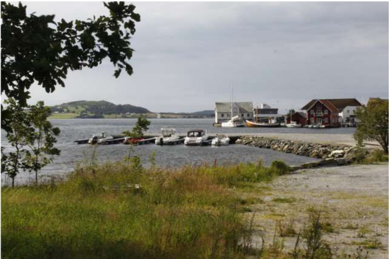
Utsikt mot sjøen